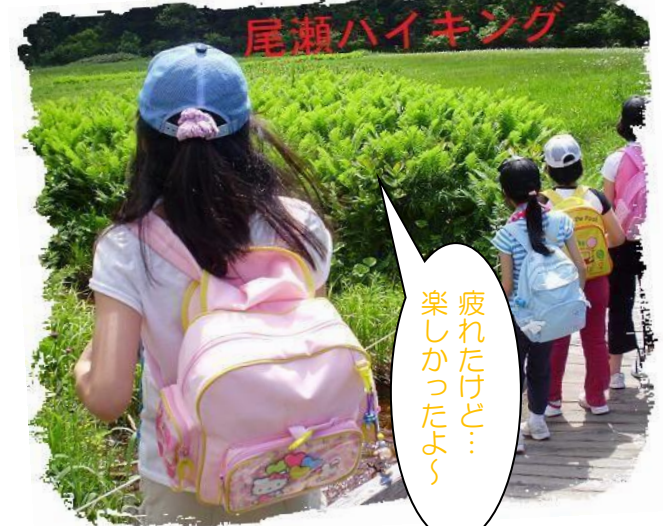
疲れたけど... 楽しかったよ