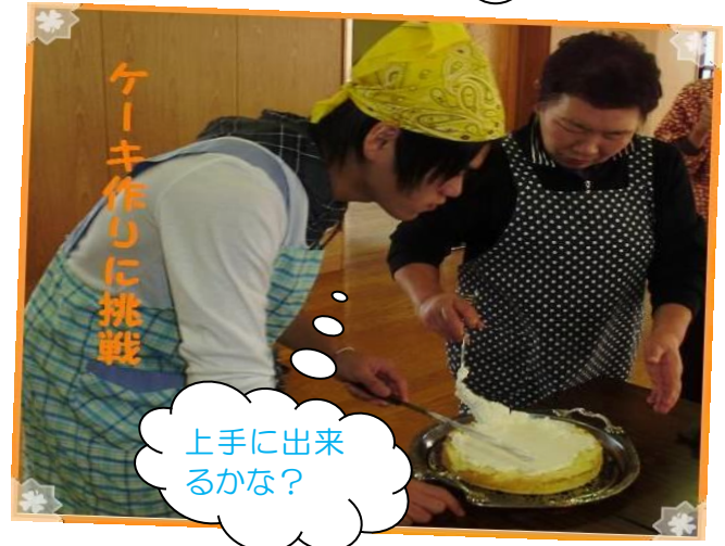
ケーキ作りに挑戦